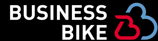
BEISPIEL SCHWARZE FARBFLÄCHE