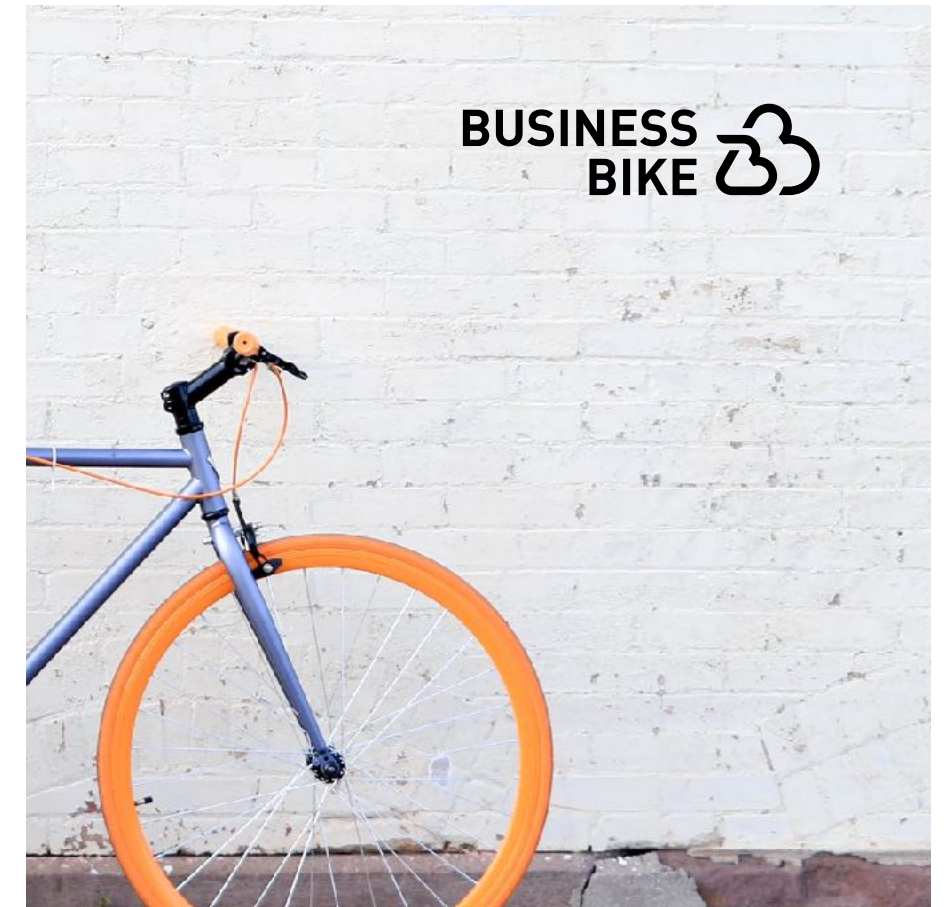
BEISPIEL HELLES BILD