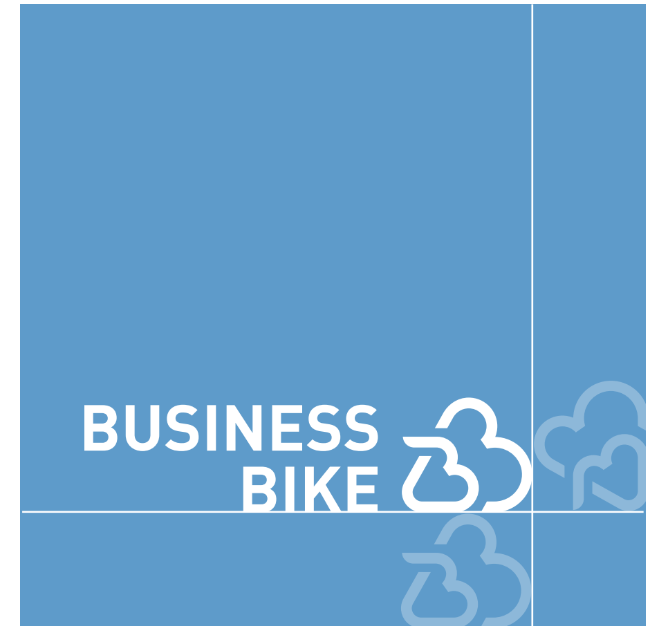
BEISPIEL SAFE SPACE